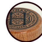
TAMPOGRAFIA SU LEGNO